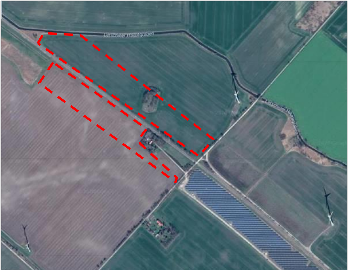
Abbildung 1: Luftbild mit der Lage der Planteile 1 und 2

Die nächstgelegene Wohnnutzung befindet sich unmittelbar östlich des Planteils 2.